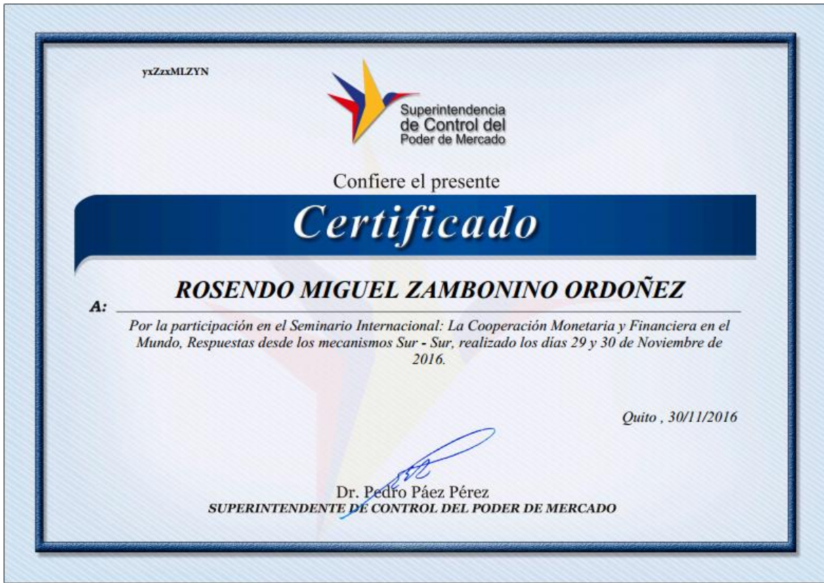
Figura 4. Certificado emitido

Al abrir el archivo descargado, se presentará el siguiente certificado.