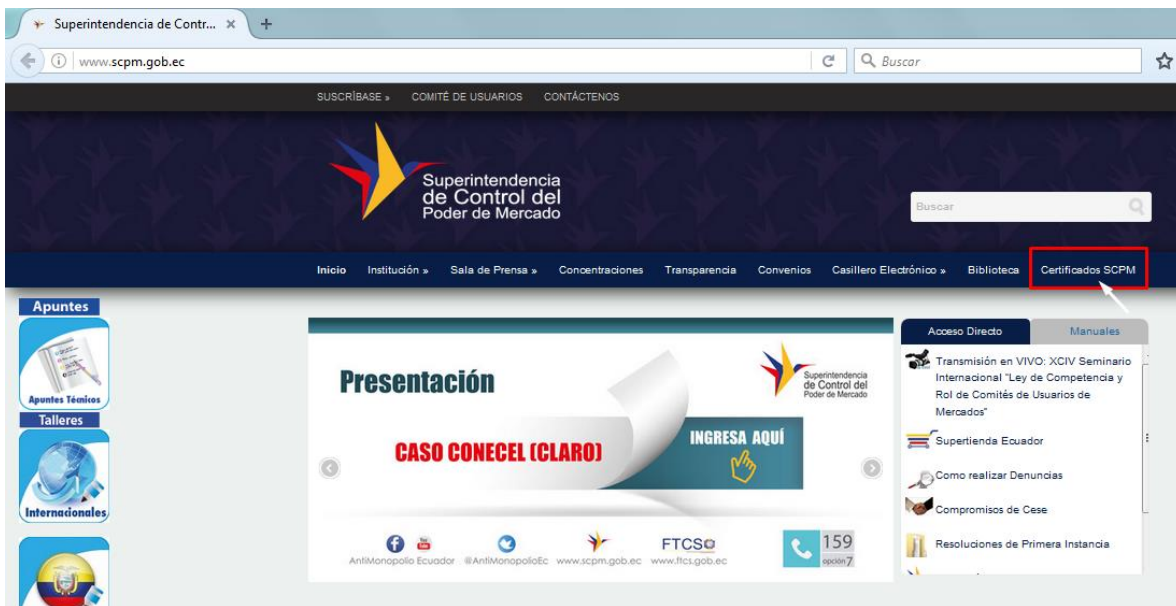
Figura 1. Página web www.scpm.gob.ec

Ingresar a la página web: www.scpm.gob.ec y dirigirse a la sección Certificados SCPM , como se puede observar en la siguiente pantalla: